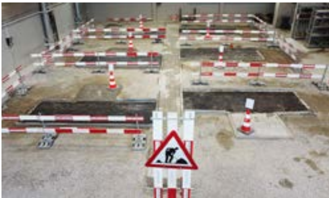
Objekt Strassenbaupraktiker*in EBA