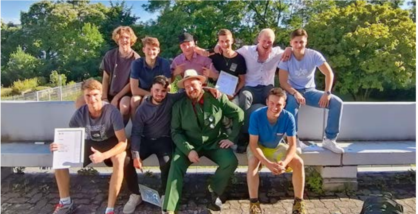
Absolventen Maurer*innen EFZ 2021

8 Einladung ERFA-Gruppe Agenda/Impressum