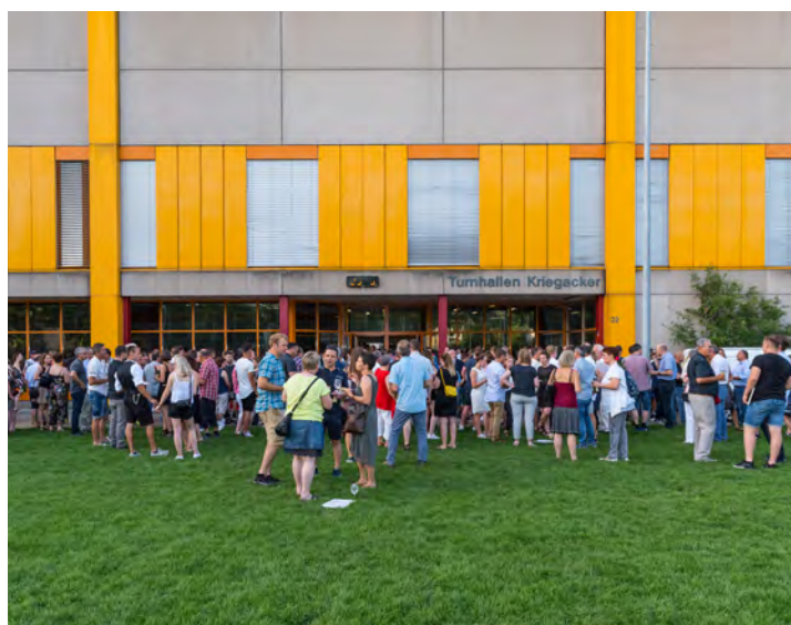
Die Anspannungen sind vorbei – der BRB lud zum Apéro nach der Diplomübergabe ein.

Mit einem Notendurchschnitt von 4.81 und der Bestnote 5.60 dürfen alle Absolventen stolz auf ihre Leistungen sein.