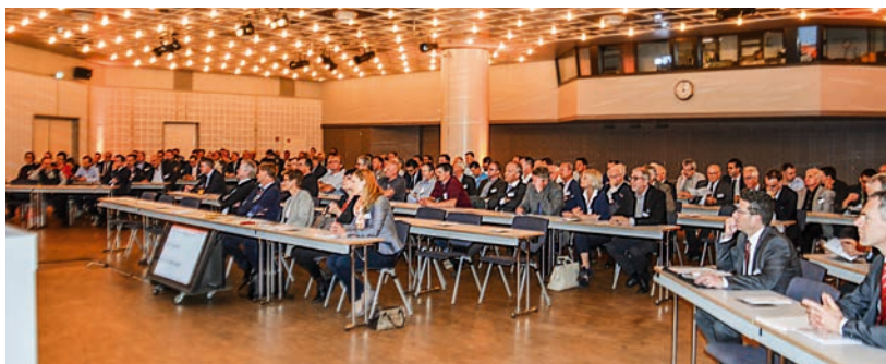
Um die 190 Mitglieder und Gäste fanden den Weg an die diesjährige Generalversammlung